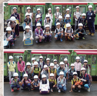
大庄小学校5年生の皆さん